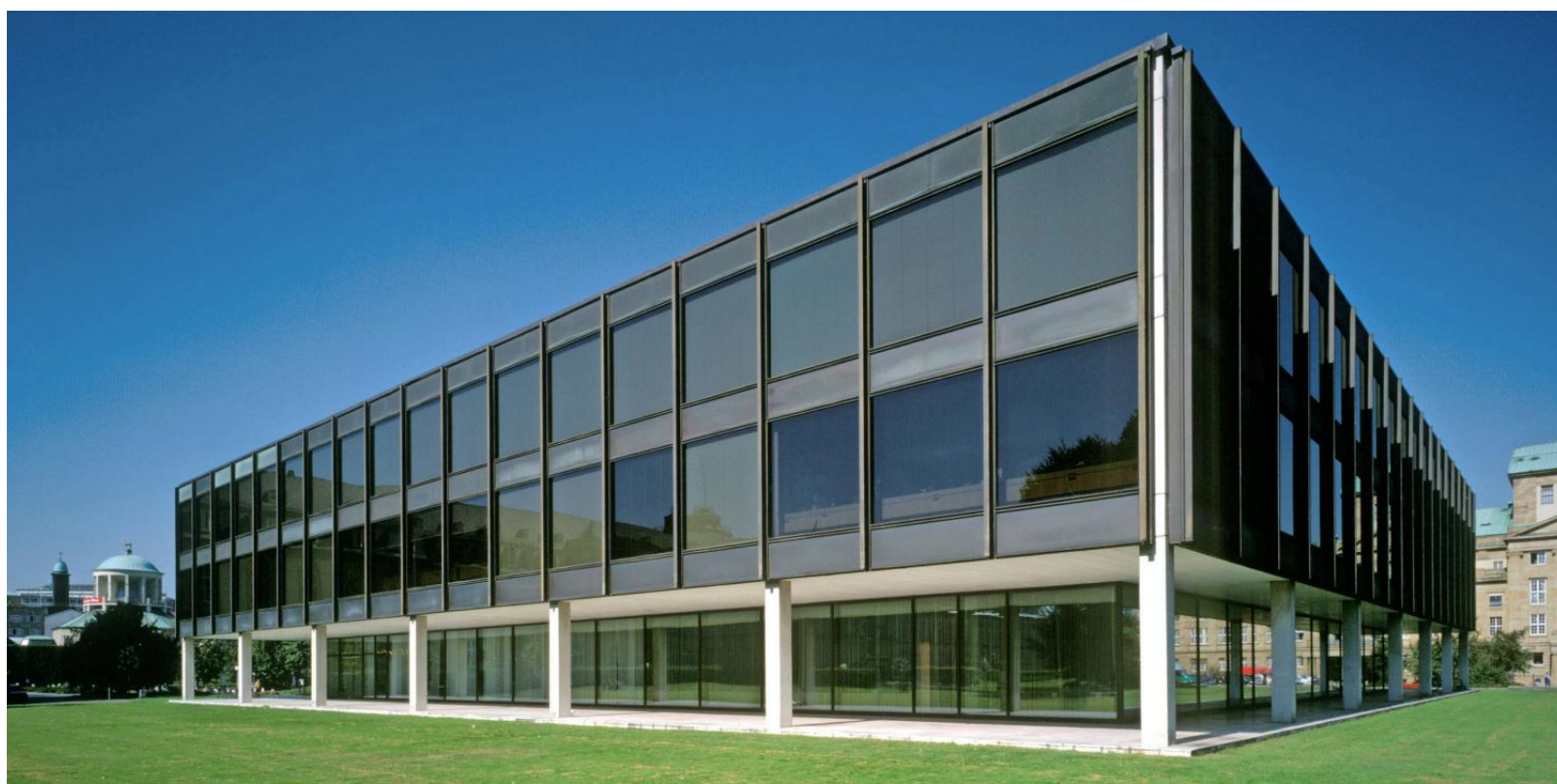
Vier Jahre lang wurde im Landtag die technische Gebäudeausstattung untersucht und optimiert.