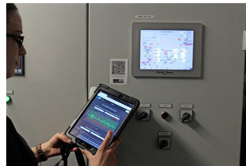
Technisches Monitoring wird in Gebäuden des Landes Baden-Württemberg schon seit 2017 eingesetzt.

Die in den AMEV-Empfehlungen enthaltenen Annahmen für mögliche Betriebskosteneinsparungen bei Anwendung des technischen Monitorings wurden in Baden-Württemberg vielfach deutlich übertroffen. „Im Landesbau Baden-Württemberg ist deshalb auch künftig vorgesehen, das technische Monitoring als Instrument zur Qualitätssicherung anzuwenden“, betont der Baudirektor. (sta)